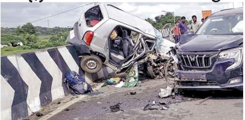
జగ్గయ్యపేట, అక్టోబరు 20, ప్రభాతవార్త : సెప్టెంబర్ 1వ తేదీన సంభవించిన భారీ వర్షాలతో కూలిపోయిన హైవేపై ట్రాక్టర్ వద్ద తల్లి, కుమారుడు అక్కడికక్కడే మృతి చెందారు.