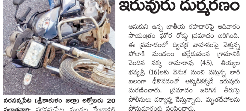
నరసన్నపేట (శ్రీకాకళం జిల్లా) అక్టోబరు 20 ప్రభాతవార్త: నరసన్నపేట మండల కేంద్రానికి