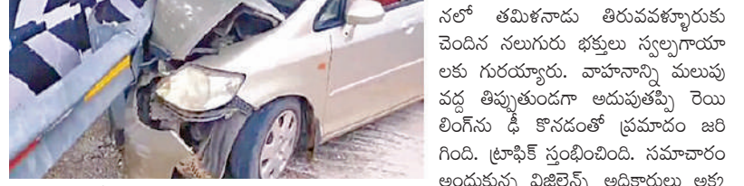
తిరుమల, అక్టోబరు 20 ప్రభాతవార్త ప్రతినిధి: తిరుమల నుండి తిరువళ్ళూరు వాహనం

తిరుమల, అక్టోబరు 20 ప్రభాతవార్త ప్రతినిధి: ఆరువేలమంది మొదటిఫోటోలో 15వ ములుపువద్ద డిజైన్లను డి.కొంది. ఆదివారం ఉదయం జరిగిన ఈ సంఘటనలో తమిళనాడు తిరువళ్ళూరుకు చెందిన నలుగురు భక్తులు స్వల్పగాయాలకు గురయ్యారు. వాహనాన్ని ములుపు వద్ద తిప్పుతుండగా ఆరువేలమంది రెయిలింగ్ను డి.కొందంలో ప్రమాదం జరిగింది. ప్రాఫిట్ స్పందించింది. సమాచారం అందుకున్న పోలీస్ అధికారులు అక్కడకు చేరుకుని వాహనాన్ని తోలగించడంతో వాహనాలు కడితాయి.