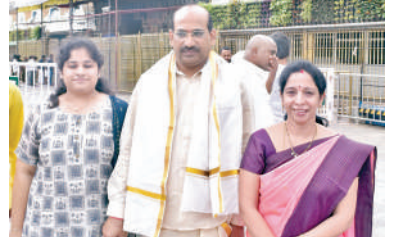
శ్రీవారి సేవలో ప్రముఖులు