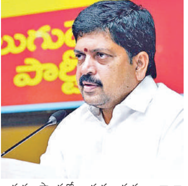
ఆయన పాలసలో ఇసుక, మద్యం ద్వారా