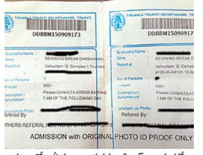
వివిపి బ్రేక్ టిక్కెట్లు